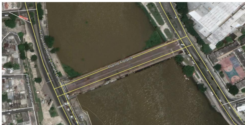
ANEXO – Ubicación del proyecto