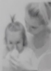
La neumonía es un agente adyuvante en la caso común.

Solo en el Hospital Infantil Robert Reid Central cada día son ingresados entre