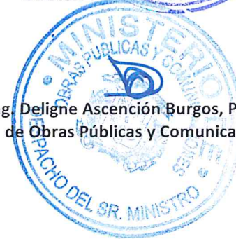
Ing. Deligne Ascención Burgos, PhD Ministro de Obras Públicas y Comunicaciones