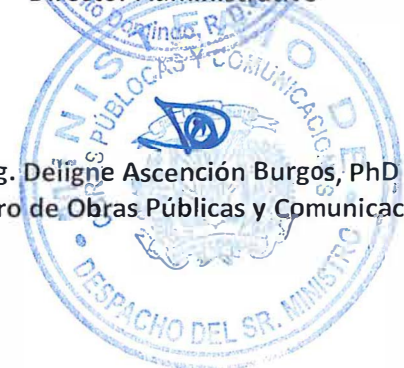
Ing. Deligne Ascención Burgos, PhD Ministro de Obras Públicas y Comunicaciones