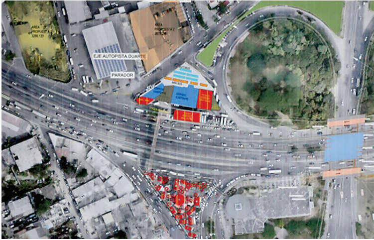
La remodelación del Km 9 quedará listo en el primer trimestre del 2023.