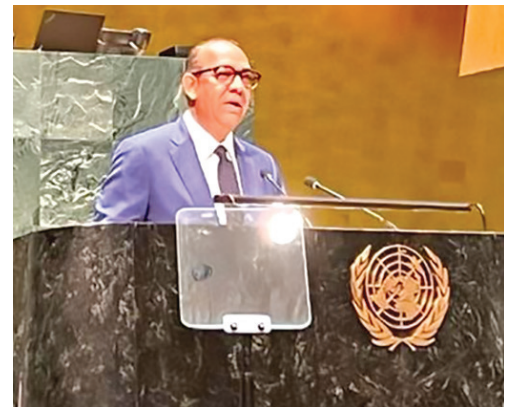
El ministro Deligne Ascención habla ante la ONU.

NACIONES UNIDAS, Nueva York. República Dominicana reafirmó ante la Reunión de Alto Nivel de la Asamblea General de las Naciones Unidas Sobre Seguridad Vial Global el compromiso de reducir al 50 % las muertes y lesiones por accidentes de tránsito en el decenio 2021-2030.