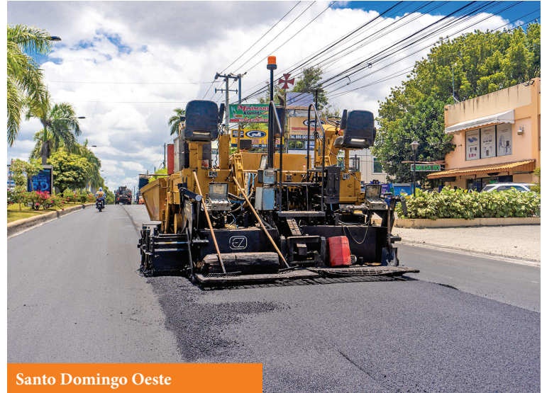
Santo Domingo Oeste