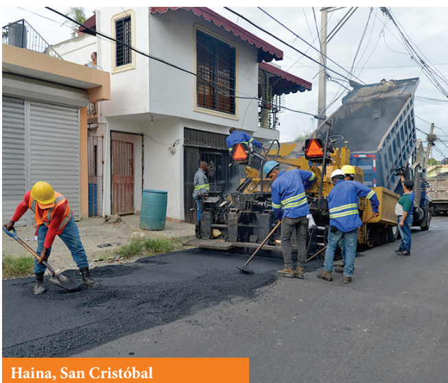
Haina, San Cristóbal