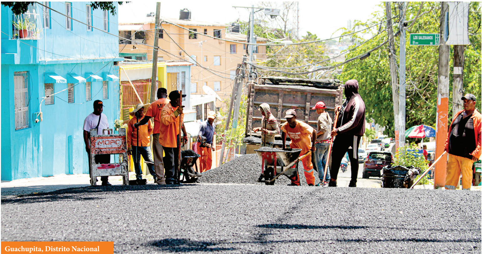
Guachupita, Distrito Nacional