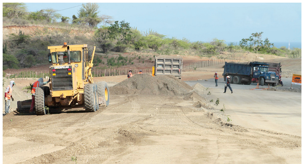
La región Sur quedará completamente conectada

Esta carretera, de 74 kilómetros de longitud, es objeto de ampliación y será dotada de varios paseos. Serán eliminadas 60 curvas peligrosas, con lo que habrá mayor garantía de seguridad y reducción de los tiempos de viaje, y en los costos de operación vehicular, lo que repercute en un mayor crecimiento económico para todo el país.