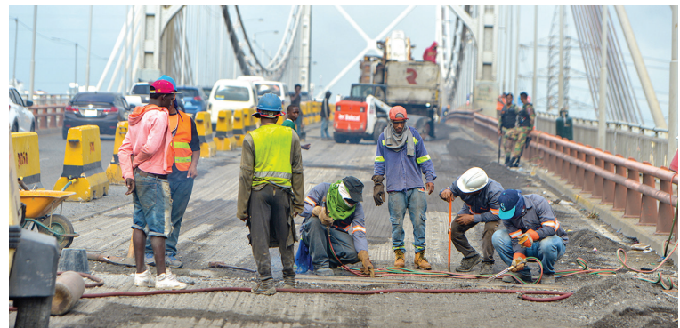
Los trabajos se realizan sin interrupción las 24 horas del día.

Con anterioridad el MOPC reparó los puentes Juan Bosch, Francisco J. Peynado, en el Distrito Nacional y el Mauricio Báez, en San Pedro de Macorís.