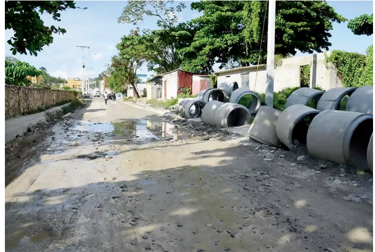
Esta avenida es una conexión directa entre los diferentes sectores de la zona de expansión y la Autopista Duarte.