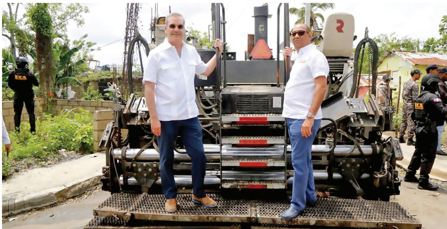
El Presidente Luis Abinader junto al Ministro de Obras Públicas, Deligne Ascención en SDO.

permanente y duradero a las personas que por allí transitan, ha tenido que hacer una inversión en drenajes verticales con tuberías de hasta 72 pulgadas de ancho y una fuerte estabilización del terreno. El Presidente Luis Abinader junto al Ministro de Obras Públicas, Deligne Ascención en SDO.