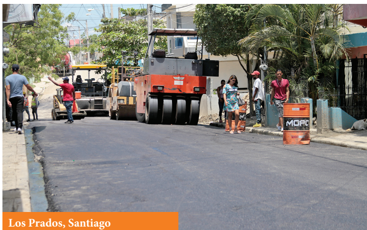
Los Prados, Santiago

De enero a mayo de este año, entre las acciones de asfaltado figuran: bacheo técnico, recapeo y colocación de carpeta asfáltica. Las acciones del Programa Nacional de Asfaltado son bien recibidas en las comunidades donde se ejecutan.