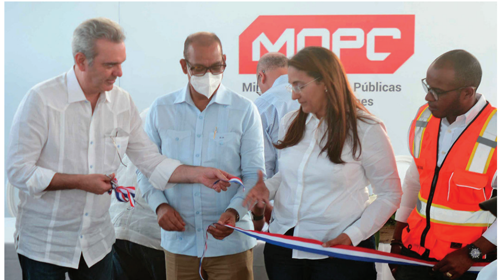
El presidente Luis Abinader cortó la cinta para inaugurar el puente Tábara Arriba.