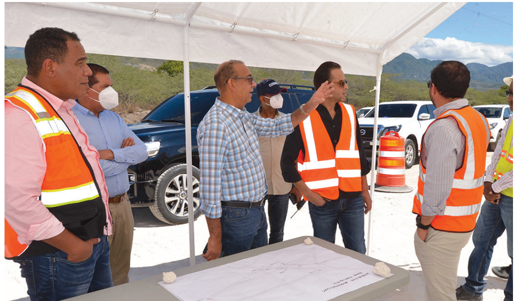
El ministro Deligne Ascención la construcción circunvalación de Azua.

Esta avenida, con longitud de 14 kilómetros, tendrá un trazado por la parte Sur de