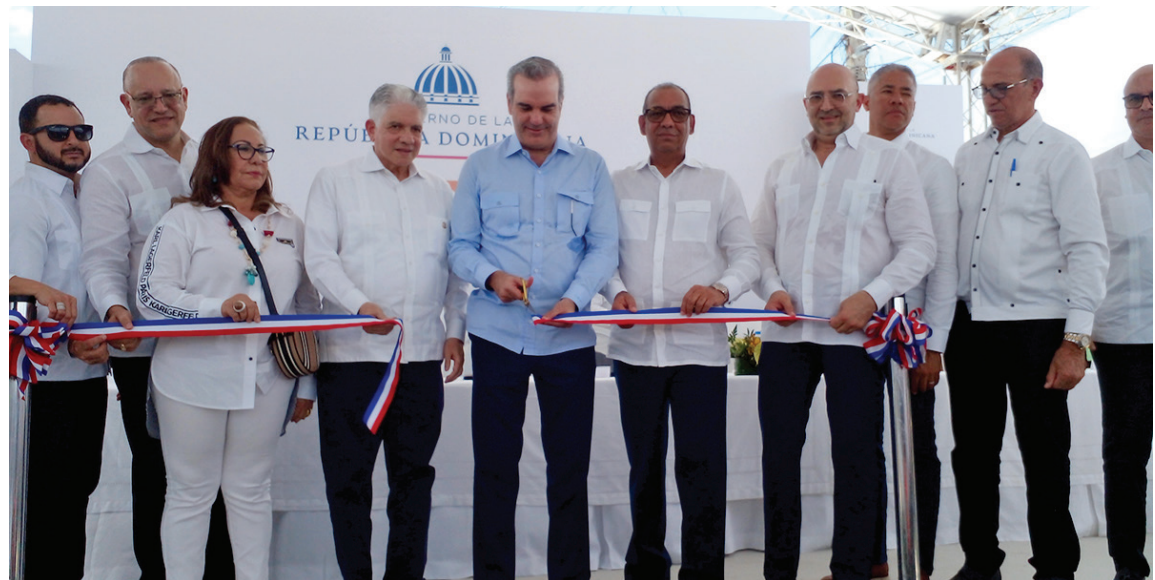
La reconstrucción de la céntrica vía conllevó una inversión superior a RD$ 20 millones.

“Esto no ha sido un simple asfaltado o recapeo, aquí ha habido todo un saneamiento, toda una corrección de proble-