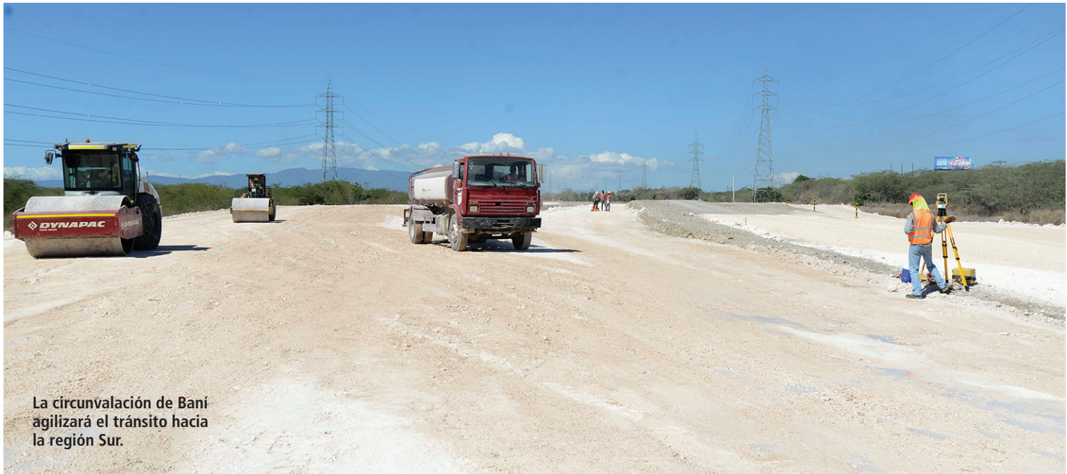
La circunvalación de Baní agilizará el tránsito hacia la región Sur.