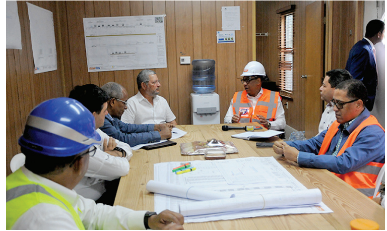
El ministro Deligne Ascención recibe informaciones de los ingenieros a cargo de la obra.