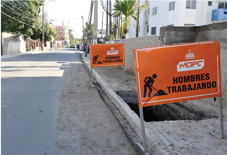
Los trabajos se realizan con una inversión que supera los RD$ 800 millones.