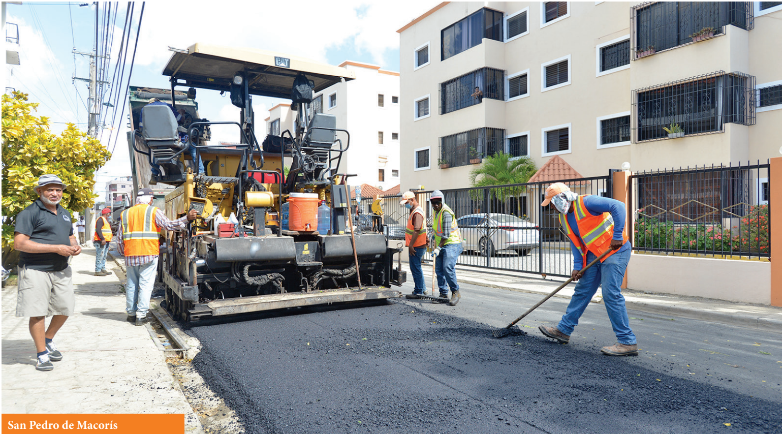
San Pedro de Macorís