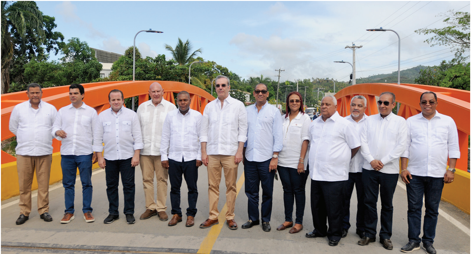
El puente El Limón era reclamado desde hace varios años por la comunidad.