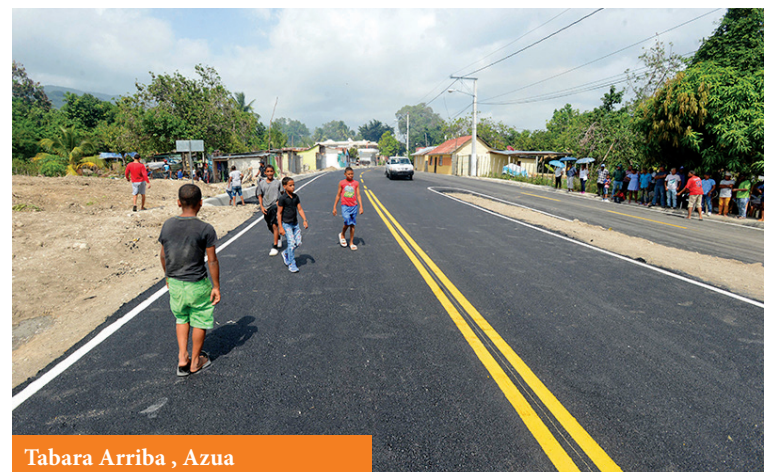
Tabara Arriba, Azua