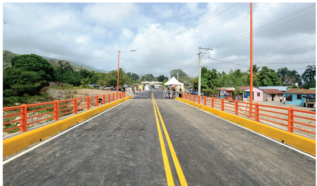
El puente era reclamado desde hace más de 30 años por la comunidad.

del puente en Tábara Arriba, también se entregaron a la provincia de Azua 30 kilómetros de caminos vecinales en Padre Las Casas-Las Lagunas-El Limón; del puente de Los Milagros hasta Botoncillo y Las Cañitas; Las Cañitas-El Tetero-El Vallecito.